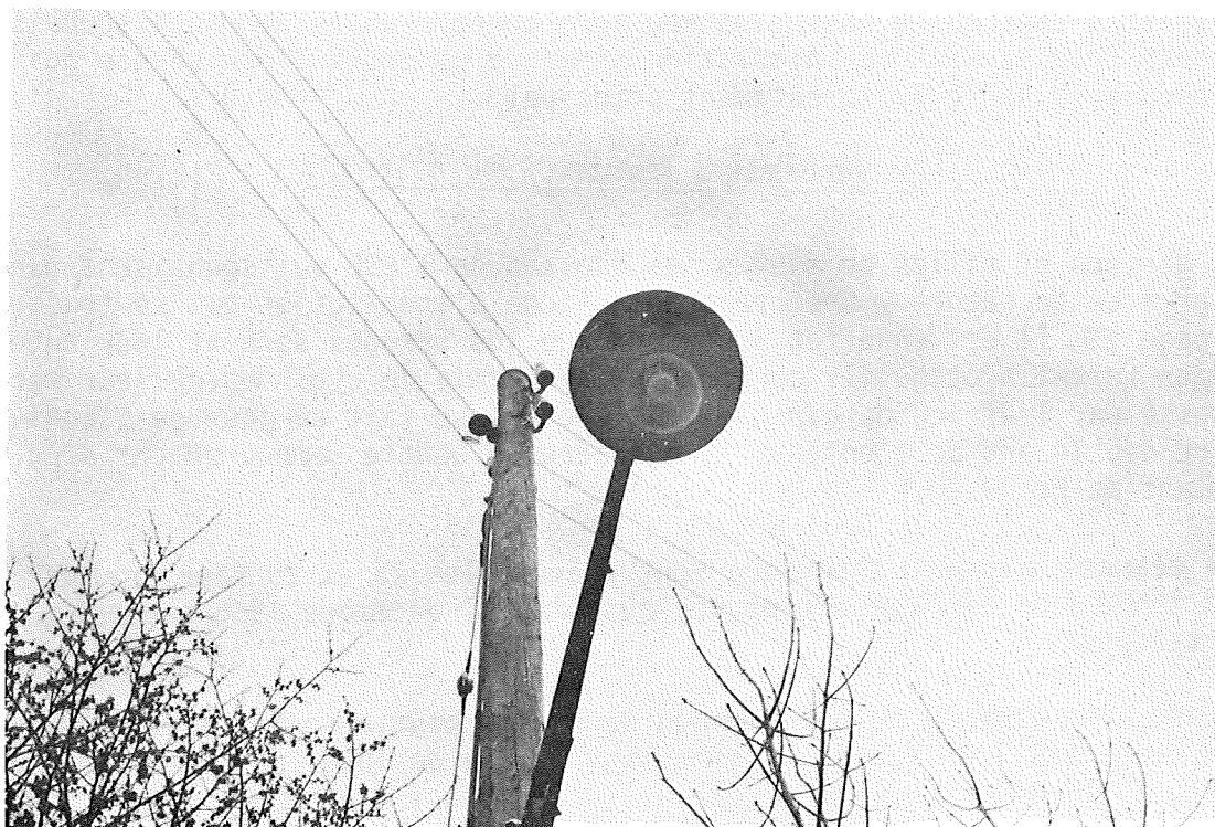
Photo réalisée par Jean-Michel DROUX, 3D, dans le cadre des ACO 1978

Plus spéculative que les autres, cette activité proposera aux élèves sensibles aux problèmes des idées une réflexion nourrie par la lecture de pages philosophiques.