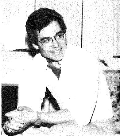
Un juge sur le banc des accusés

Présenter ses oeuvres à un public, surtout pour la première fois, c'est accepter un jugement de cour dont on ne sait si l'on ressort blanc ou noir.